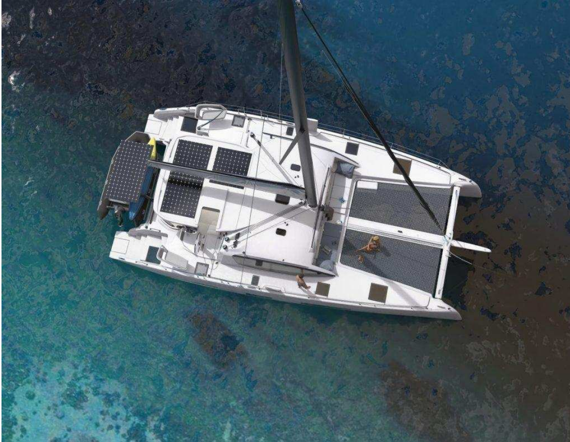
Die Outremer 52 feiert Weltpremiere.

der Messe zu beobachten sein: Die Anzahl der Motorkatamarane wird immer höher und auch die Hybridantriebe nehmen immer mehr zu.